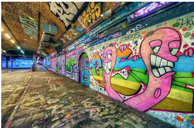
Największe graffiti świata – rekord Guinnessa z 2014r. w Londynie.

Na pewno niejednokrotnie podczas spacerów po mieście widzieliście pomalowane ściany budynków, mury i chodniki. Niektóre z nich ożywiają ulice, sprawiają, że wokół jest bardziej kolorowo i wesoło, inne z kolei wywołują silne, nie zawsze pozytywne emocje. "Malunkami" tymi jest graffiti.