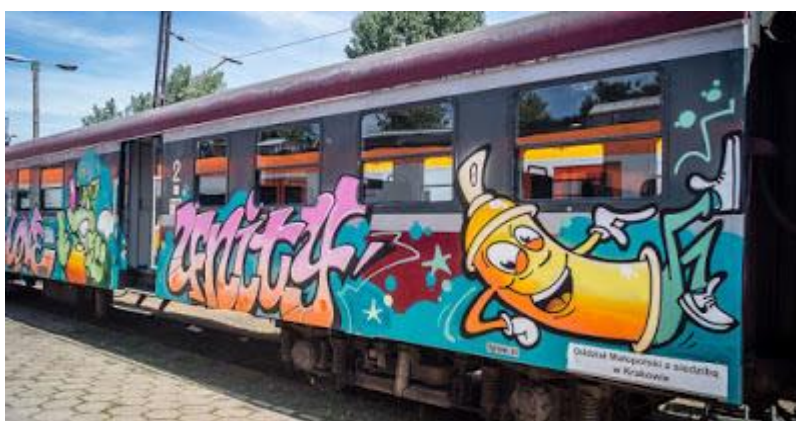
Kolejowe graffiti na pociągu z okazji ŚDM

Terminem tym określamy napisy, symbole i obrazy, które zostały namalowane przez ulicznych artystów na ścianach budynków, w przejściach podziemnych, na ogrodzeniach, na murach ogrodzeniowych, na parkingach ale również na pociągach czy autobusach.